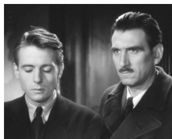
1942 LE VOYAGEUR DE LA TOUSSAINT de Louis Daquin avec Jean Desailly