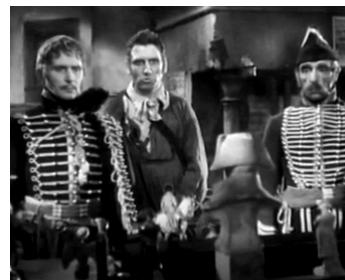
1942 PONTCARRAL, COLONEL D'EMPIRE de Jean Delannoy avec Pierre Blanchar