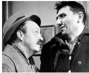
1932 LA TÊTE D'UN HOMME de Julien Duvivier avec Harry Baur