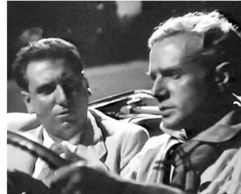
1936 COURRIER SUD de Pierre Billon avec Pierre Richard-Willm