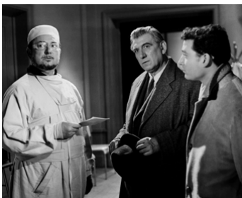
1959 LES YEUX SANS VISAGE de Georges Franju avec Pierre Brasseur, Claude Brasseur