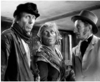
1943 LES MYSTÈRES DE PARIS de Jacques de Baroncelli avec G. Kerjean, J-P. Martial