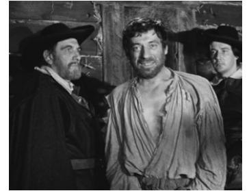
1956 LES SORCIÈRES DE SALEM de Raymond Rouleau avec Yves Montand