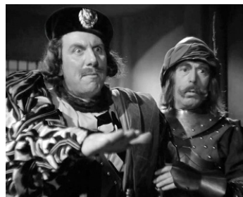
1940 VOLPONE de Maurice Tourneur avec Robert Seller