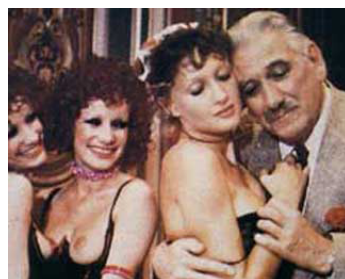
1974 LES BIJOUX DE FAMILLE de Jean-Claude Laureux