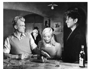
1943 L'ÉTERNEL RETOUR de Jean Delannoy avec Jean Marais, Madeleine Sologne