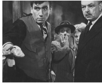
1944 LE MYSTÈRE DE SAINT-VAL de René Le Hénaff avec Pierre Renoir