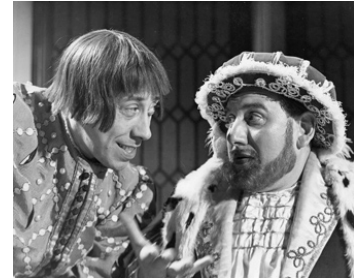
1937 FRANÇOIS I er de Christian-Jaque avec Fernandel