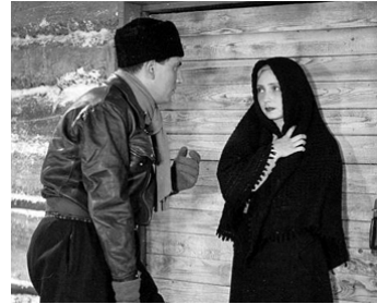
1934 MARIA CHAPDELAINE de Julien Duvivier avec Madeleine Renaud