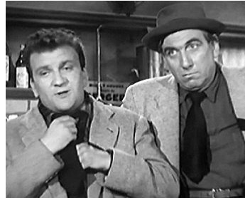
1951 LE COSTAUD DES BATIGNOLLES de Guy Lacourt avec Pierre Mondy