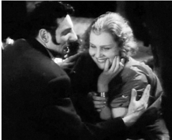
1935 LA SYMPHONIE DES BRIGANDS de Friedrich Feher avec Magda Sonja