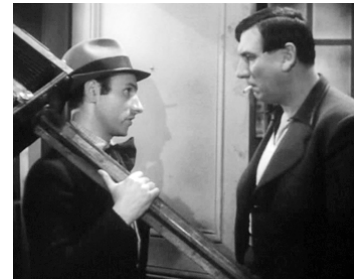
1939 LES MUSICIENS DU CIEL de Georges Lacombe avec Sylvain Inkine