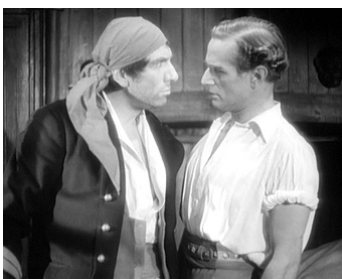
1942 LE COMTE DE MONTE-CRISTO de Robert Vernay avec Pierre Richard-Willm