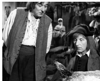
1959 LE BOSSU d'André Hunebelle avec Bourvil