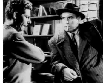
1948 FANTÔMAS CONTRE FANTÔMAS de Robert Vernay avec Jo Charrier