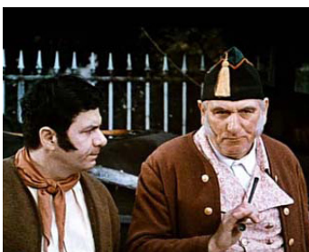
1965 LA SENTINELLE ENDORMIE de Jean Dréville avec Michel Galabru