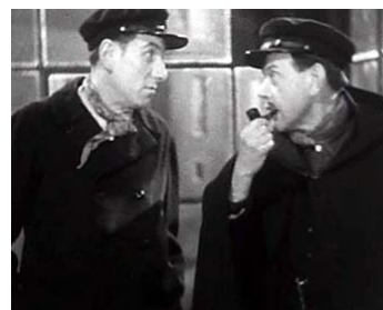
1943 L'HOMME DE LONDRES d'Henri Decoin avec Fernand Ledoux