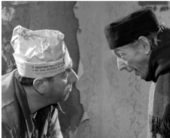
1953 LE RETOUR DE DON CAMILLO de Julien Duvivier avec Édouard Delmont