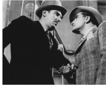
1934 JUSTIN DE MARSEILLE de Maurice Tourneur avec Antonin Berval