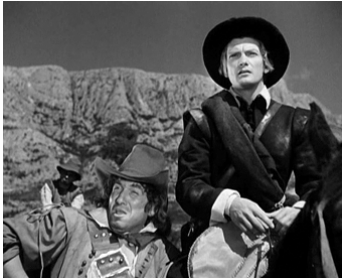
1946 RUY BLAS de Pierre Billon avec Jean Marais