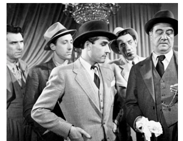
1942 LE BIENFAITEUR d'Henri Decoin avec Lucien Gallas, Raimu