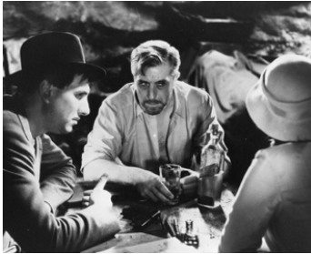
1934 L'AVENTURIER de Marcel L'Herbier avec Victor Francen