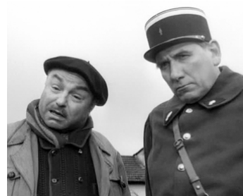
1952 NOUS SOMMES TOUS DES ASSASSINS d'André Cayatte avec René Blancard