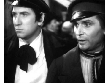
1935 CRIME ET CHÂTIMENT de Pierre Chenal avec Pierre Blanchar