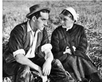
1936 LA TERRE QUI MEURT de Jean Vallée avec Germaine Sablon