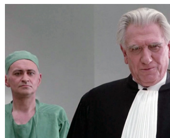
1974 IL FAUT VIVRE DANGEREUSEMENT de Claude Makovski avec Michel Delahaye